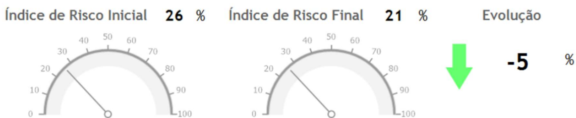
Figura 1 - Índice de Risco em abril de 2024 e em abril de 2025

A implementação das várias ações permitiu descer o nível de risco global em 5%, não se registando quaisquer riscos elevados ou máximos. A figura 5 ilustra o índice de risco global em abril de 2024, considerando as medidas mitigadoras já implementadas, e o nível de risco em abril de 2025, considerando a avaliação após a implementação das medidas adicionais.